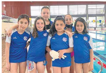
Equipo alevín femenino del Club Natación Avilés.