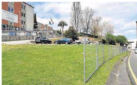
Ya se ha vallado el perímetro del colegio para iniciar las obras.

Esta primera fase, que contempla el vallado del perímetro y la preparación del espacio, está previsto que dure hasta el 12 de abril. Será a partir de esa fecha cuando las máquinas comenzarán a trabajar y empiecen a contar los plazos del proyecto.