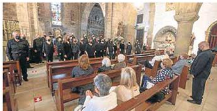
La Polifónica del Centro Asturiano ayer, durante su actuación.

cada uno de los cursos que se imparten en el centro. La gala, que se prolongó durante toda la mañana, comenzó con los estudiantes de Educación Primaria, a los que siguieron sus compañeros de la ESO. Por último, subieron al escenario los mejores integrantes de la promoción de Bachillerato, quienes cerraron el acto.