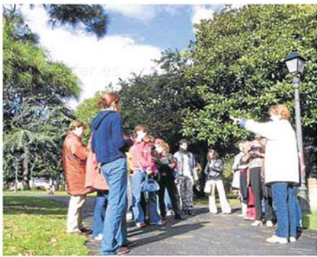
Turistas en el parque de Ferrera antes del estallido de la pandemia.

Habrá que esperar al 23 de julio para disfrutar de la segunda