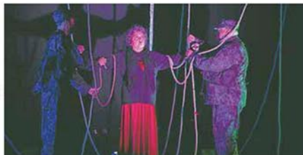
Puesta en escena de 'Antígona' en el Centro de Los Canapés.