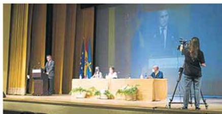
Intervención de las autoridades del centro previa a la ceremonia. LVA