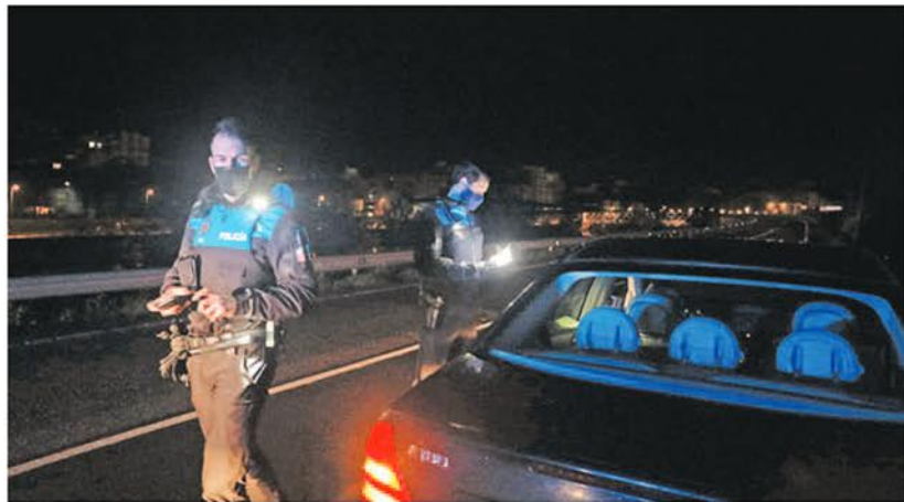
Dos agentes inspeccionan un vehículo durante el toque de queda, en la arteria del puerto.

Derivado de la actuación, siempre según los agentes, fueron detenidas cinco personas: un varón de 40 años, una mujer de 38 años, un varón de 18 y dos menores de 16 y 15 años, todos vecinos de Avilés, siendo trasladados a dependencias de la Policía Nacio-