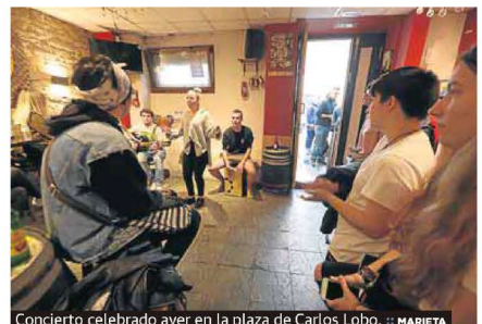
Concierto celebrado ayer en la plaza de Carlos Lobo.

rio Magdalena, en las inmediaciones del pabellón de exposiciones. Estuvo protagonizada por alumnado de tercero y cuarto curso de Educación Primaria del colegio público Marcos del Tornello del barrio de Versailles. La de ayer fue la última sesión del presente curso escolar.