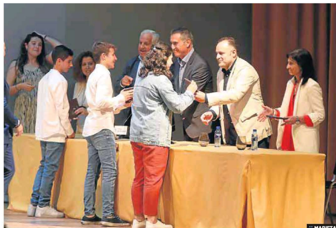
GALA DEL DEPORTE EN EL COLEGIO SAN FERNANDO

Actividades de sala y cancha, como aeróbic con step, yoga, iniciación al yo, GAP, pilates, iniciación al pilates, multiactividad, multiactividad GAS-CORE, multiactividad para corredores y corredoras, multiactividad para adolescentes y jóvenes, multiactividad para niñas y niños, gimnasia de mantenimiento para personas adultas (mayores de 16 años), gimnasia para mayores de 64 años, zumba, hipopresivos y ciclismo indoor. También habrá actividades al aire libre, mediante cursillos de tenis y gimnasia al aire libre en parques.