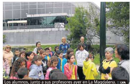
Los alumnos, junto a sus profesores ayer en La Magdalena.

ción Amigos contra la Droga de Avilés instalará una mesa informativa sobre drogas y sobre el Centro de Tratamiento para las Adicciones que dirige la citada asociación. A las 12 se leerá un manifiesto alusivo a la jornada. También han realizado un mural en el exterior del centro.