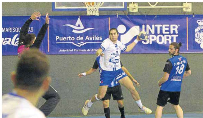
Los lanzamientos del zurdo Murias fueron una de las armas del Toscaf Atlético ayer.