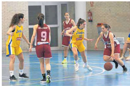
Un ataque de La Biblioteca Innobasket en el Sanfer.

AVILÉS. La Biblioteca Innobasket se llevó el primer derbi avilesino de la fase de descenso de Primera Nacional en el Colegio San Fernando frente al Zumosol (48-62). Lo que prometía ser un partido igualado y