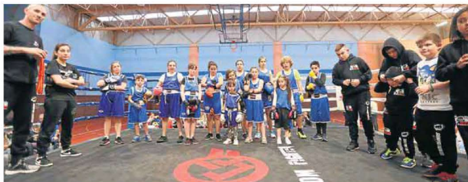
Los 'peques' del Toa, que realizaron una exhibición, posan ante la cámara de LA VOZ.