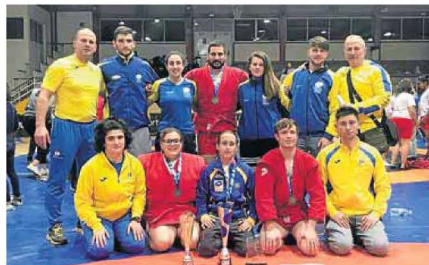
Expedición del Club Óscar Fernández.