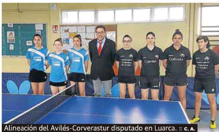
Alineación del Avilés-Corverastur disputado en Luarca.