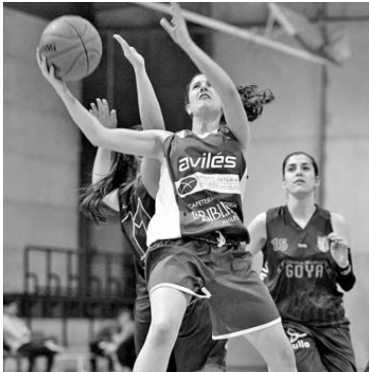
Una jugadora del Innobasket busca la canasta ante el Unami.

Sin embargo, el cuarto periodo fue para olvidar. El conjunto gijonés consiguió una canasta de dos y un triple que hizo pasar la diferencia de los 11 a los 6 puntos y el Innobasket desapareció de la cancha.